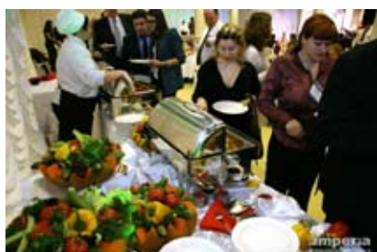
Зона итальянской кухни