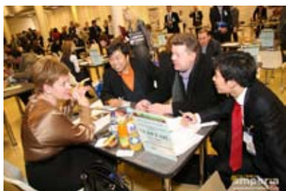
Переговоры о поставках с компанией X5 Retail Group