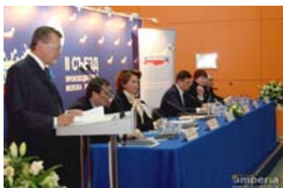
В. Зубков, Первый Вице-премьер Правительства РФ