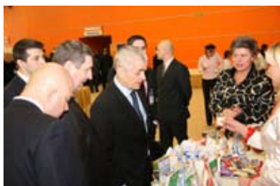
Г. Онищенко, Руководитель Роспотребнадзора