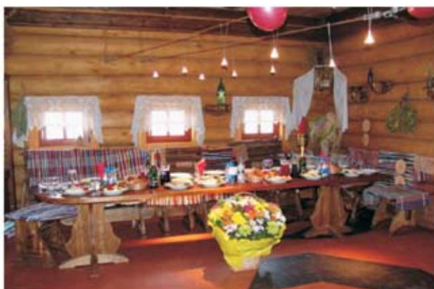
Музей Русской Водки