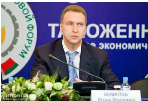
И. Шувалов, Первый Вице-премьер Правительства РФ