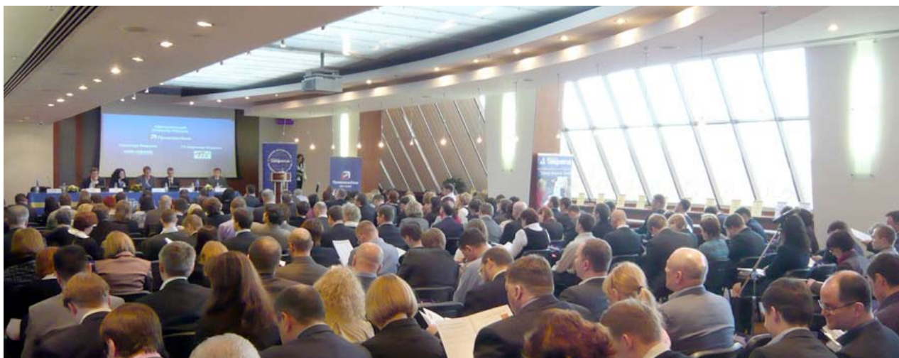
VI Всероссийский Антикризисный Форум

отражение проблемы рынка потребительских товаров в контексте финансового кризиса, а также аналитика, прогнозы, исследования рынка FMCG.