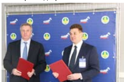
Подписание соглашения между СОЮЗМОЛОКО и Росагролизингом