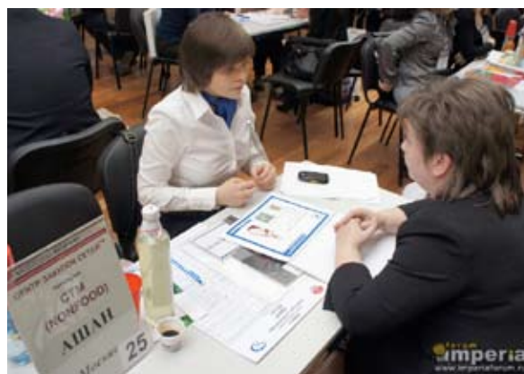
Переговоры о поставках с сетью Metro C&C