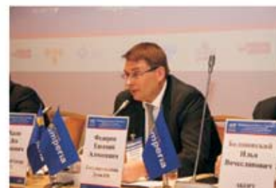
Е. Федоров, Государственная Дума