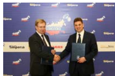
Подписание соглашения между СОЮЗМОЛОКО и ММВБ