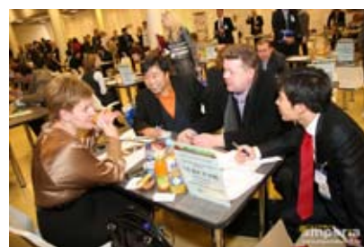
Переговоры о поставках с компанией X5 Retail Group