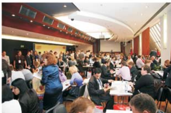
Центр Закупок Сетей™