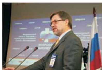
А. Цыганов, ФАС России