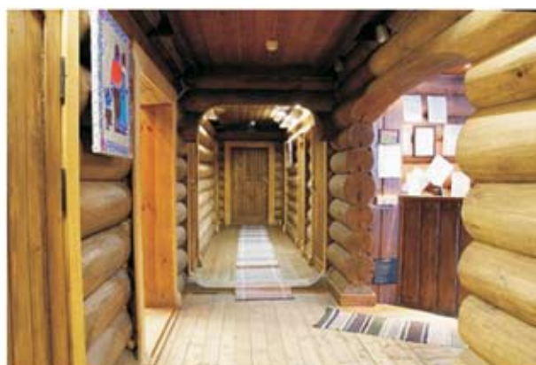
Интерьер гостиницы «Кошель»