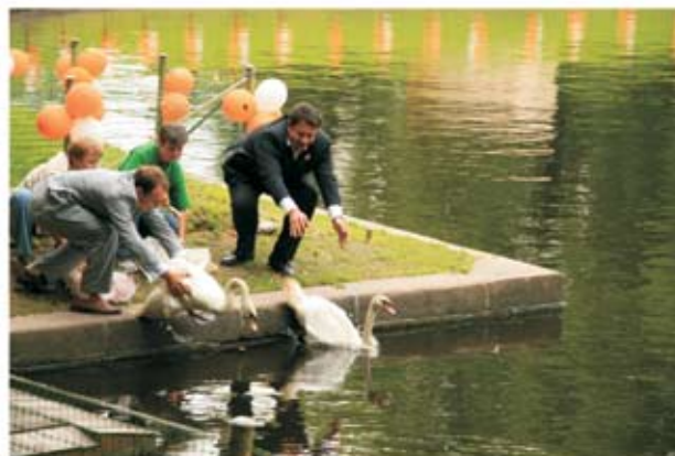
Церемония «Лебеди в подарок Летнему Саду»