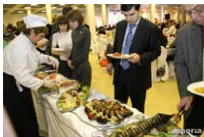
Зона финской кухни