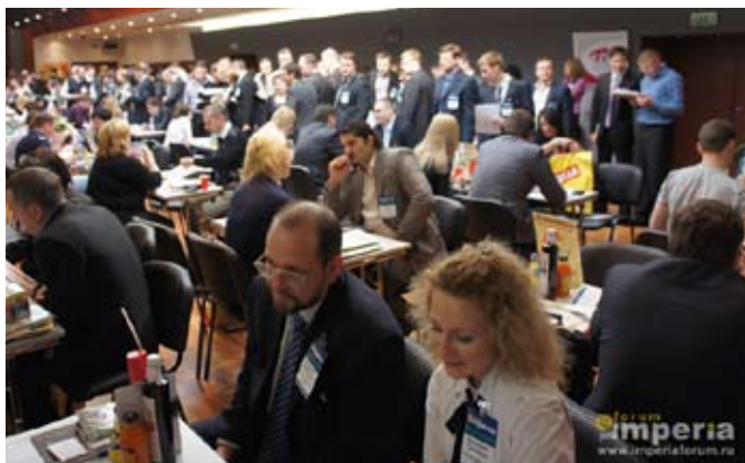
Центр Закупок Сетей™