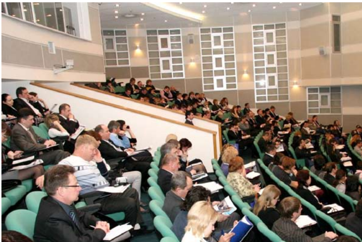
VI Всероссийский Торговый Форум

Продовольственный Форум; расширенный Центр Закупок Сетей™; Биржу по Собственным Торговым Маркам; конкурсы «Выбор сетей» и «Инновационный продукт»; Всероссийский Банкет Директоров.