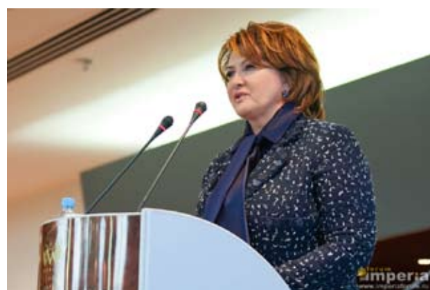
Е. Скрынник, Министр сельского хозяйства РФ