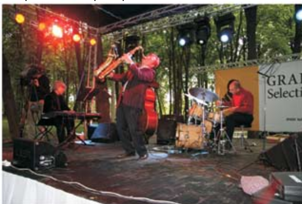
И. Бутман, всемирно известный джазмен