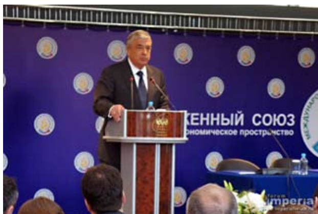
П. Бороздин, Госсекретарь Союзного государства России и Беларуси