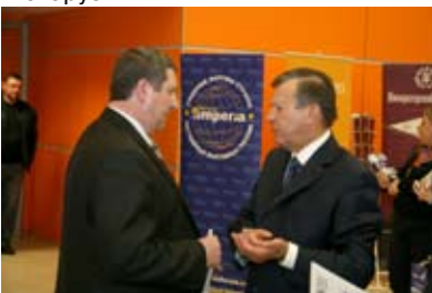
В кулуарах: В. Зубков, Правительство РФ и М. Русый, Минсельхоз Беларуси