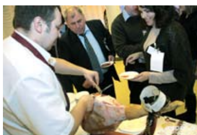
Зона испанской кухни на Гурме-Банкете