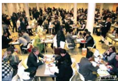
Центр Закупок Сетей™