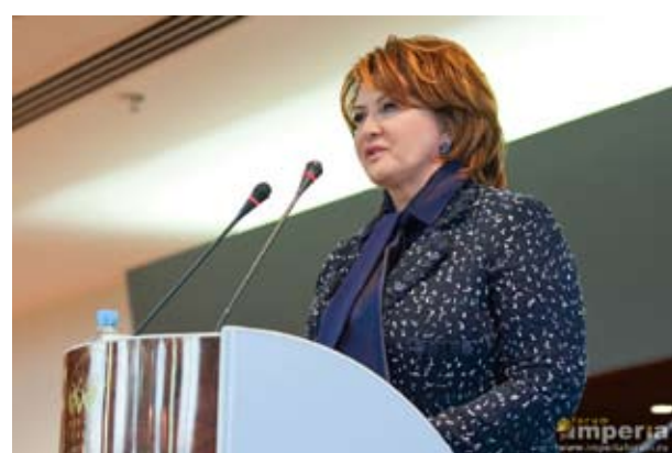
Е. Скрынник, Министр сельского хозяйства РФ