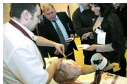
Зона испанской кухни