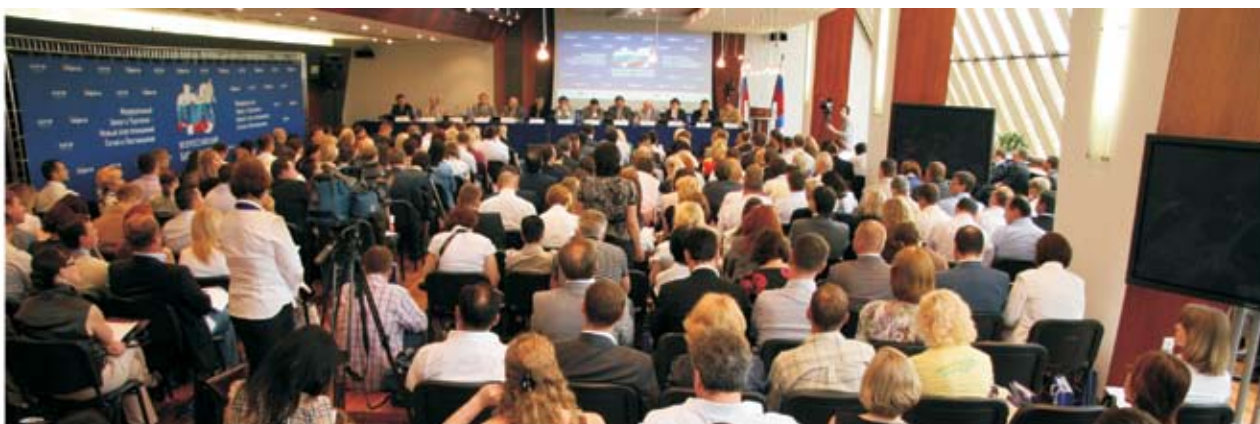
Всероссийский Бизнес-Форум «ФЗ о Торговле»

В свете принятия нового ФЗ о Торговле в июне 2010 года проведен Всероссийский Бизнес-Форум «Федеральный Закон о Торговле - Новый этап отношений Сетей и Поставщиков». Мероприятие стало регулярным событием,