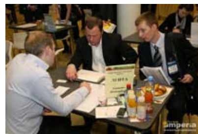
Переговоры о поставках с сетью Лента