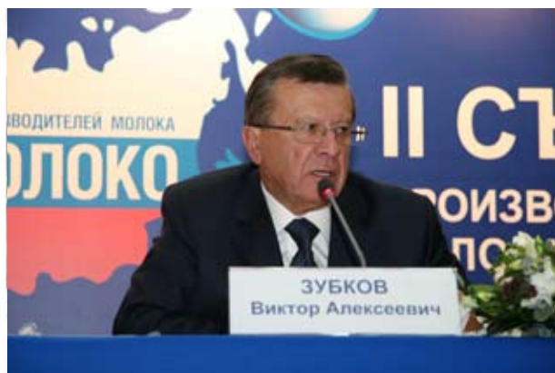
В. Зубков, Первый Вице-премьер Правительства РФ