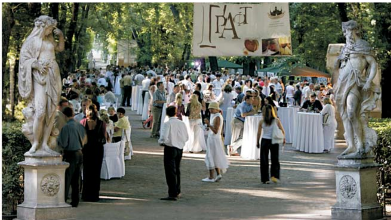
Ежегодный Променад-Концерт «Искусство - Музыка - Вино»

незабываемый праздник для ценителей хорошей музыки, изысканных напитков и приятной атмосферы теплого июньского вечера в Летнем саду.