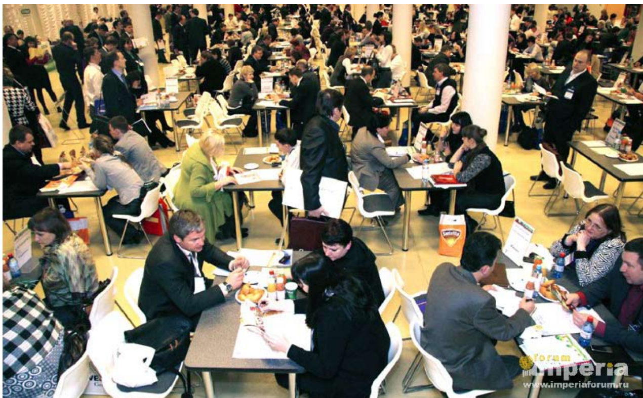
265 закупщиков из 116 розничных сетей в Центре Закупок Сетей™ на Продэкспо-2011

В рамках Центра Закупок на Продэкспо-2011 400 производителей и дистрибуторов провели индивидуальные переговоры по предварительной записи с 265 закупщиками из 116 розничных сетей. В Центре Закупок работали закупщики X5 Retail Group (сети «Пятерочка», «Карусель», «Перекресток»); Ашан; Дикси; Лента; О'Кей; Spar; Billa; РегионМарт; Федерального Закупочного Союза ЗАО «Система «ТЗС»; Мария-Ра и мн.др.