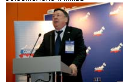
В. Захарьящев, Госдума РФ