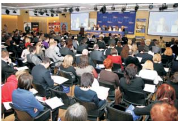
Всероссийский Торговый Форум на «Продэкспо»

Сегодняшние ресурсы компании позволяют проводить порядка 50 конференций в год.