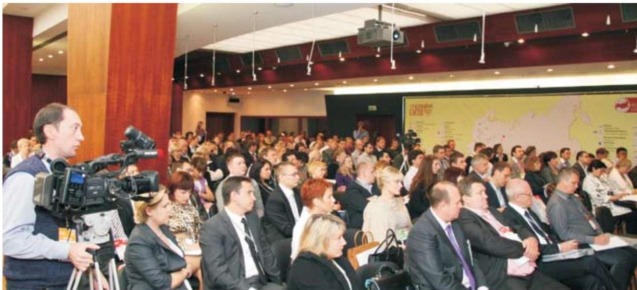
Всероссийский Съезд Собственников Независимых Сетей-2010

провела КВК «Империya» впервые организован Центр Закупок Сетей™ Союза Независимых Сетей России.