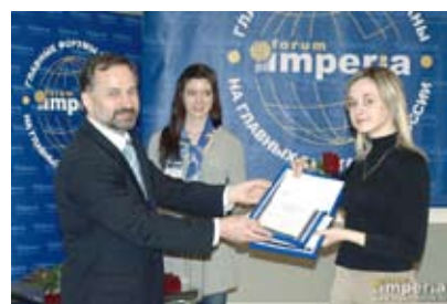
Награждение победителей конкурса «Выбор Сетей»