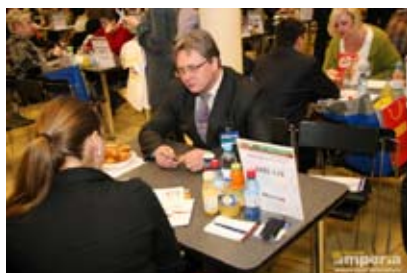
Переговоры о поставках с сетью Ашан