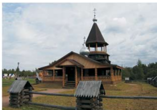
Церковь в честь Рождества Пресвятой Богородицы