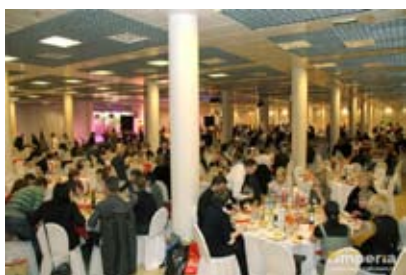
Гурме-Банкет Директоров на Продэкспо-2011